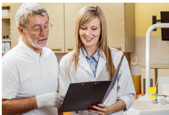
La formation supérieure de coordinatrice en médecine ambulatoire suscite un grand intérêt auprès des assistantes médicales.

Pour les assistantes médicales, le calendrier – qui prévoyait de débiter immédiatement les travaux pour le projet CNC – doit être modifié en raison de la révision