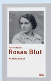
Rosas Blut von Peter Hänni